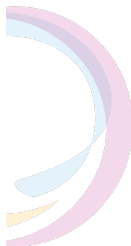
Bogen Farbe 20 %