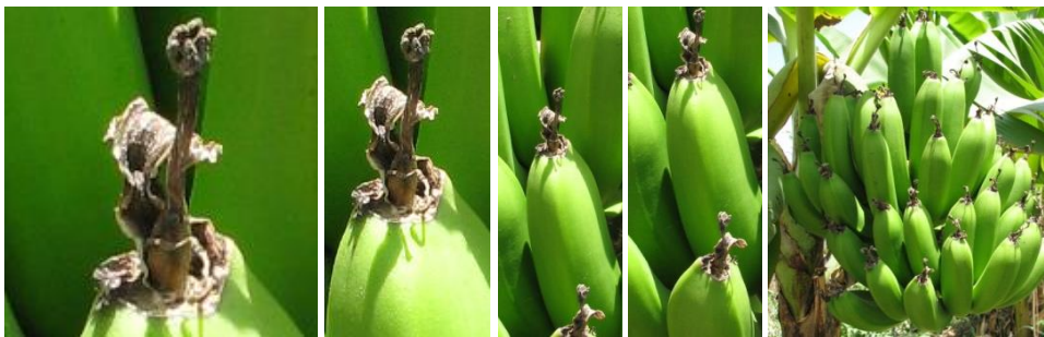
-> banana tree

What's on the picture: (die Bilder werden nacheinander gezeigt, so dass das Motiv immer besser erkennbar ist)